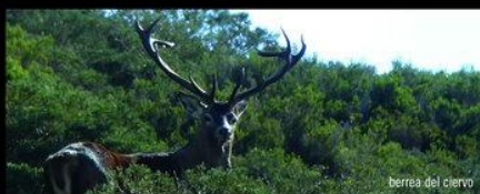
berrea del ciervo