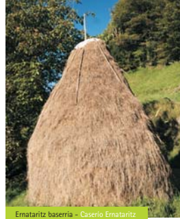
Ernataritz baserria - Caserio Ernataritz

Si partimos desde Errezil debemos situarnos junto a la iglesia parroquial y ascender por la estrecha e irregular calle situada frente a ella, donde se encuentra la señal de inicio del recorrido. Si por el contrario iniciamos la excursión desde Zestoa nos situaremos frente al Hotel Arocena, cruzaremos la carretera por el paso subterráneo y continuaremos por la derecha tomando la vía que asciende a Akoa. Recomendamos hacer esta ruta en sentido Errezil-Zestoa para tener los desniveles a nuestro favor. Partiendo desde Errezil una primera parte del recorrido nos exigirá una subida constante de unos 3 km en la que atravesaremos zonas de caseríos y un bosque denso y bien conservado. Transcurridos unos 500 metros del caserío Ernataritz, el último de Errezil, la subida habrá concluido, y nos habremos situado en un estupendo balcón sobre el Urola, en la zona de Semerohaitz. Nos llamará la atención ver cómo el camino está acotado por dos muros de piedra que cierran sus respectivas campos para mantener los rebaños