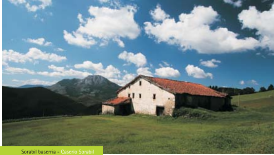
Sorabil baserria - Caserio Sorabil

Gure aholkua ibilbidea Errezildik Zestoara egitea da, bi herrien arteko aldea behean dagoen kale estu eta irregularretik gora egin behar da; bertan dago ibilbidearen hasiera adierazten duen marka. Ibilbidea Zestoan hasiz gero, berriz, Arocena hoteletik abiatu, errepidea lurpeko igarobidetik gurutzatu eta eskuinerantz jarraitu behar da, Akoarantz gora.