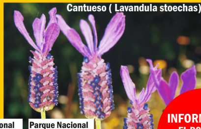
Cantueso ( Lavandula stoechas)