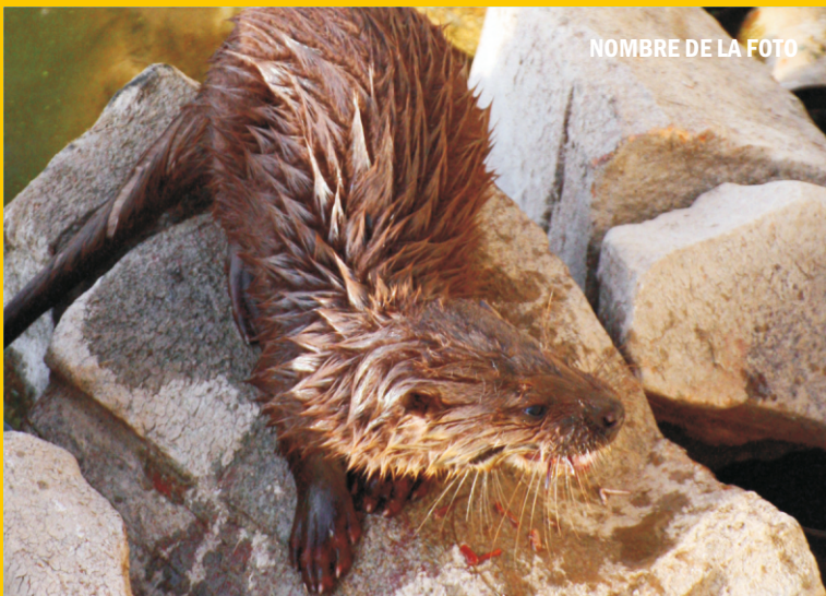
NOMBRE DE LA FOTO

Km. 8,36 - Latitud: 39°10' 1,63" N Longitud: 4°15' 14,70" W Coordenada X: 391.660,77m Coordenada Y: 4.336.071,19m Continuamos por la pista sin hacer caso de un camino que cruza el río.