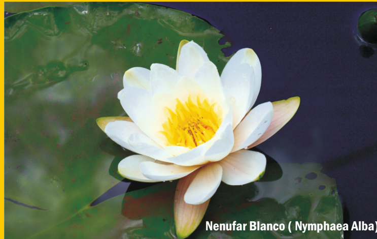
Nenufar Blanco ( Nymphaea Alba)

La comarca turística Entreparques se localiza en el norte de la provincia de Ciudad Real, formando una franja que se extiende de oeste a este entre los Montes de Toledo y la Llanura Manchega, contando con una superficie de 6.064 km 2 .