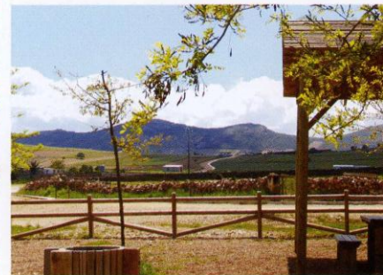
La ruta transcurre por zonas de cultivos de olivar, dehesa y monte bajo mediterráneo.

La Barriada de la Estación, situada a 2 km del pueblo, ha ido formándose junto a la estación de ferrocarril de Madrid a Badajoz, y ha prosperado principalmente a causa de movimiento de ganado del Valle de Alcudia, y de toda la región circundante, que durante muchos años ha estado utilizando preferentemente el transporte por tren.