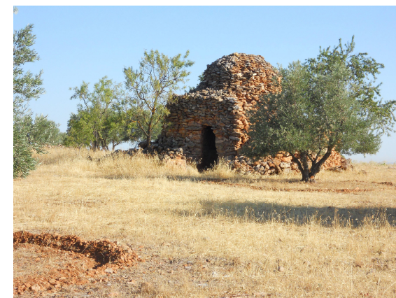
Chozo típico solanero.

En los alrededores de La Solana podemos ver diferentes construcciones en piedra seca denominadas en la localidad como “chozos”. El Chozo solanero suele ser un elemento integrado totalmente en el paisaje, dado que al ser construido con calizas del terreno, da la sensación de surgir de la propia tierra. Así, desde el punto de vista histórico, diversos autores argumentan que los bombos actuales tienen sus orígenes en construcciones de épocas prehistóricas.