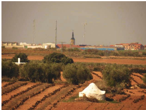
[Chozo típico y La Solana al fondo]

La Solana es un municipio con 16.700 habitantes situado en la provincia de Ciudad Real. Con un término municipal de 134 kilómetros cuadrados, se ubica en el extremo sureste de la provincia dentro de la comarca de La Mancha. Limita al norte con Tomelloso y Argamasilla de Alba. Al oeste con Membrilla y Manzanares, al sur con Valdepeñas y San Carlos del Valle, y al este con Alhambra y Ruidera. Desde el punto de vista topográfico La Solana es el comienzo del Campo de Montiel. Así lo revela la ondulación del terreno. La presencia de calizas refleja, asimismo, su pertenencia a esta comarca geográfica. Incluido, como el resto de la región, en el dominio de la España mediterránea, el término municipal de La Solana se caracteriza por un clima continentalizado con grandes amplitudes térmicas que reflejan temperaturas negativas con grandes heladas y calores cercanos e incluso superiores a los 40° en verano.