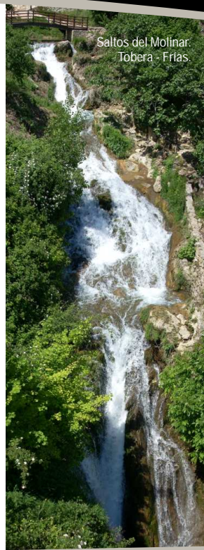
Salto del Molinar. Tobera - Frías.