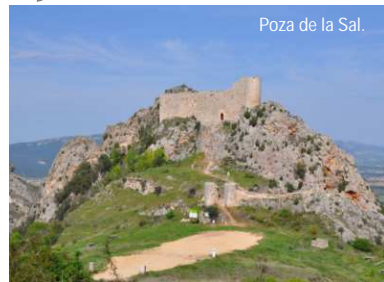
Poza de la Sal.

El fenómeno diapírico hizo aflorar a la superficie una gran masa salina. Desde tiempos de los romanos hasta hace tres décadas, la actividad salinera ha condicionado la vida y la economía pozana. La sal ha dejado un gran legado patrimonial y etnográfico único en Europa. Las salinas se distribuyen por el salero, un amplio espacio declarado Bien de Interés Cultural. Bajo el Castillo protector, se expande un conjunto amurallado con sus antiguas puertas, sus plazas, sus calles estrechas, su iglesia, el Palacio y Fuente Buena.