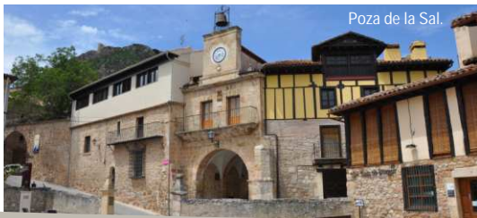
Poza de la Sal.

Sus confortables alojamientos rurales, su variada oferta gastronómica y sus amables gentes son otros alicientes para una visita inolvidable.