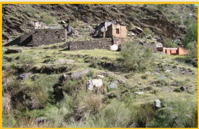
Escuela de las Chozas