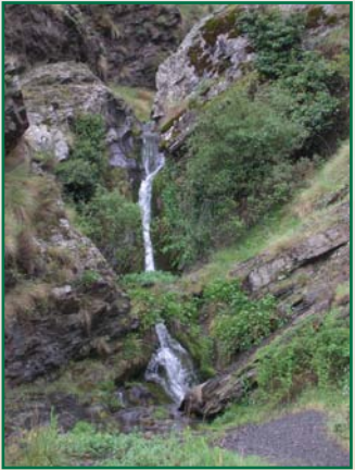
Cascada de Piedra Horadadas

Entre la frondosidad del bosque accedemos al “Barranco del Diablo” donde el terreno circundante es muy abrupto, nos encontramos con grandes encinas milenarias, así como grandes cascadas, que transportan el agua del deshielo de las cumbres.