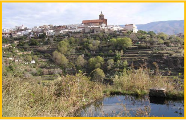
Vista de Abrucena