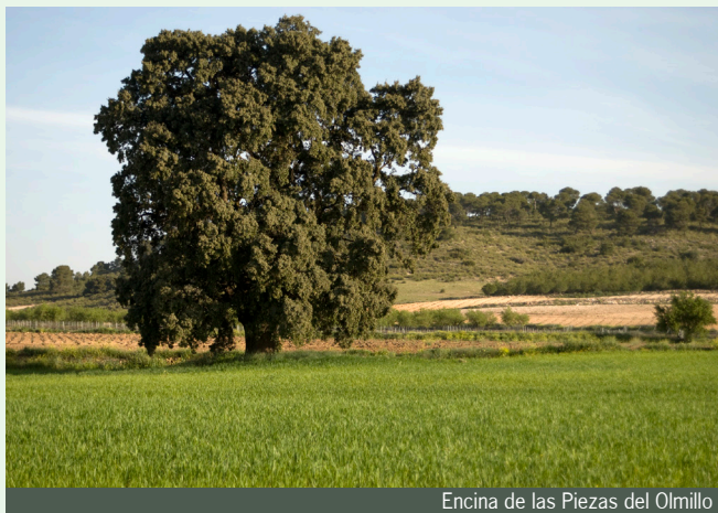
Encina de las Piezas del Olmillo

Entre las tradiciones más arraigadas de Fuente Álamo destaca la conocida romería de San Marcos y San Marquicos, que se celebran los días 25 y 26 de abril, y en las que todo el pueblo se reúne en el Cotico para disfrutar de comidas campestres. Esta costumbre se relaciona con la conmemoración de la histórica Batalla de Almansa en el año 1707.