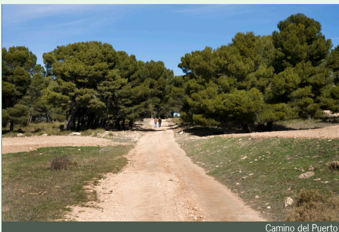
Camino del Puerto