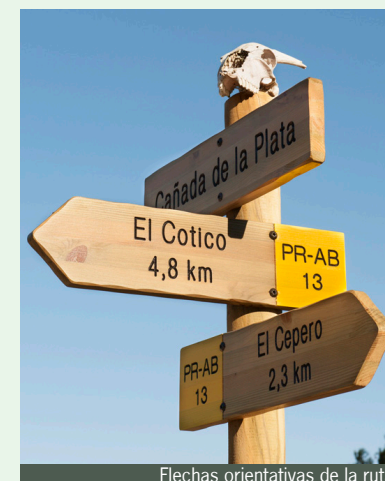
Flechas orientativas de la ruta

Señalización de senderos de pequeño recorrido (PR)